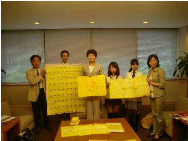
全国の学校からたくさんのイエローカードが寄せられました

今年の「世界中の子どもに教育を」キャンペーンには、全国の小・中・高校・大学から、351校、41,940人が参加。昨年の2倍の参加がありました。また事後学習として、教育支援の拡充を願うメッセージを首相宛に届けるイエローカードが8,138人分寄せられ、高校生から政務官へ手渡されました。